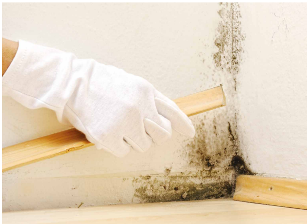
Parfois bien visibles, les moisissures peuvent aussi être cachées derrière une plinthe par exemple.

On peut également observer dans les logements humides une dégradation des colles des panneaux de particules (meubles...) avec dégagement de COV (par exemple le formaldéhyde).