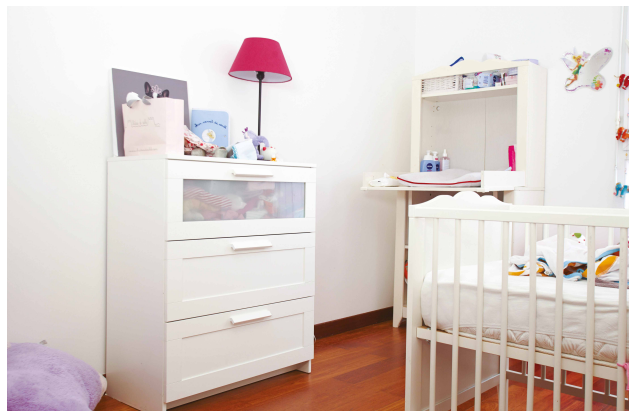
Si vous aménagez la chambre d'un bébé, faites-le bien avant sa naissance et aérez souvent pour évacuer les polluants émis par les meubles.

De même, une ventilation mal installée ou mal entretenue peut favoriser la présence de polluants et les disperser dans le logement.