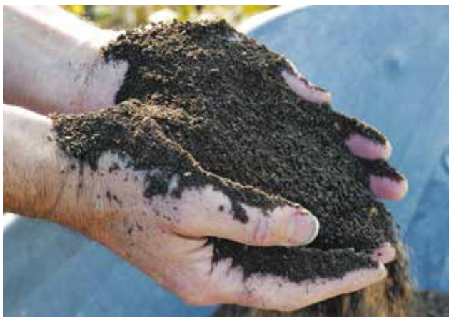
Le compost mûr se caractérise par sa couleur foncée et sa structure grumeleuse.

Il favorise la croissance des plantes et leur développement racinaire.